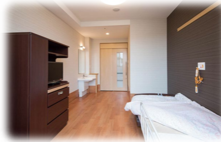
トイレ(介助も可能)