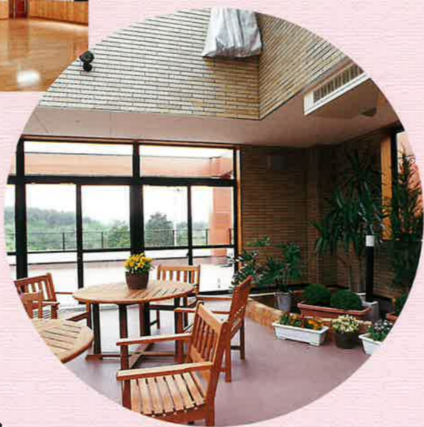
●ガーデニングルーム

地域ボランティアグループの方々のアトラクションや、趣味活動等を通じて、入居者と楽しいひとときをすごしていただくためのスペースです。