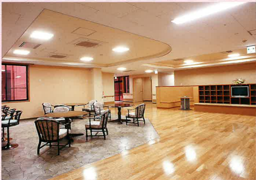
●喫茶&談話コーナー

ゆったりとした空間の中に落ち着いた雰囲気 の喫茶・談話コーナーです。仲間同士や家族 とのふれあいスペースとなっております。