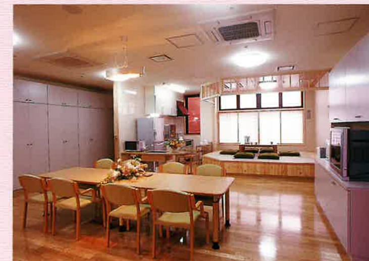
●各ユニットリビング