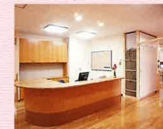
●ユニットステーション

各フロアごとにキッチンや 収納スペース、談話室等の ふれあいスペースを十分に とりながらも、一人ひとりの 生活空間を大切にしたい 完全個室タイプになって おります。また、各フロア にはユニットステーション がありケア体制も万全です。